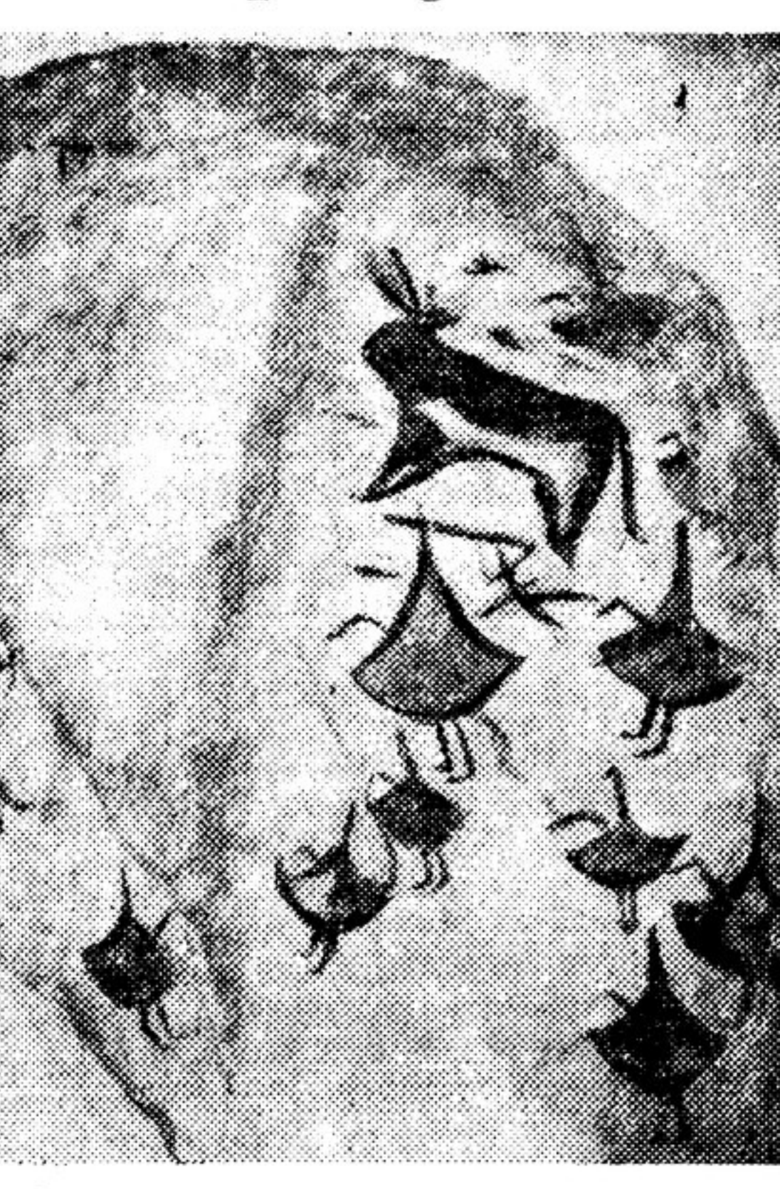
Наскальный рисунок в ущелье Зарзат-Сая.

Быки, изображенные то в «летящем галопе», то упершись в землю; собаки, завернувшие головы назад «за стойку», — все это столь примитивно, но живо, реалистично