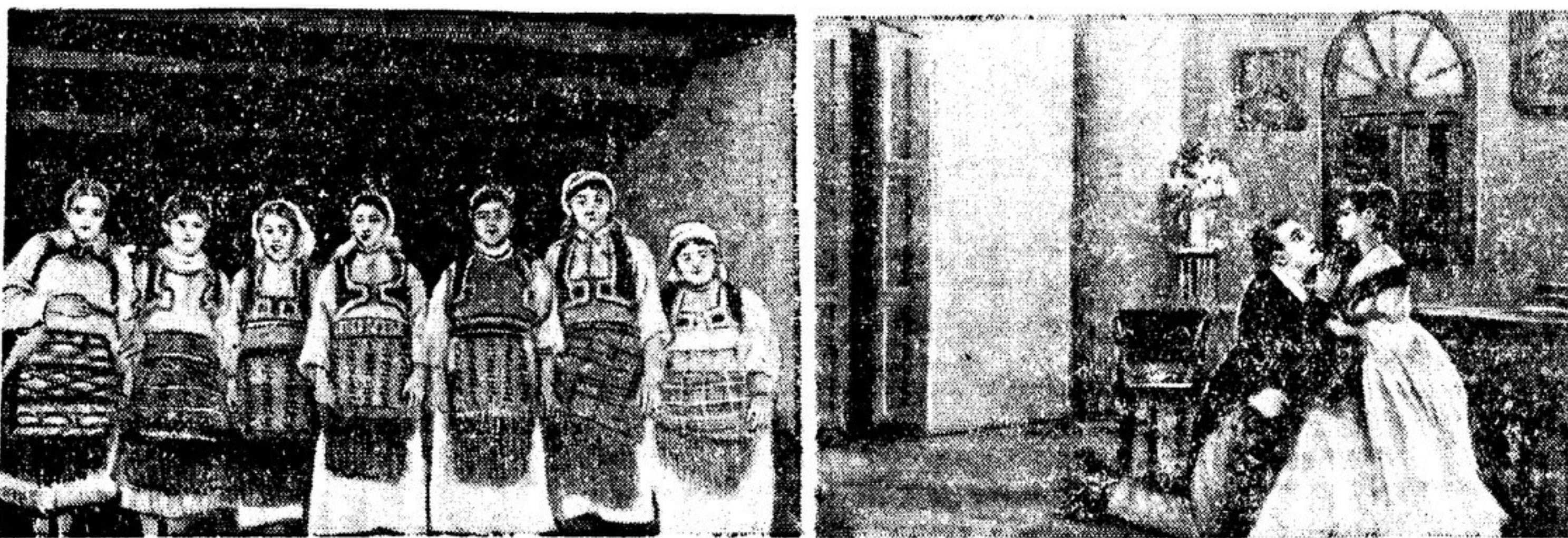
Югославский «Театр народного освобождения». На снимках: хор крестьянок (слева), сцена из «Ревизора» (справа).

ЮГОСЛАВСКИЙ ТЕАТР НАРОДНОГО ОСВОБОЖДЕНИЯ