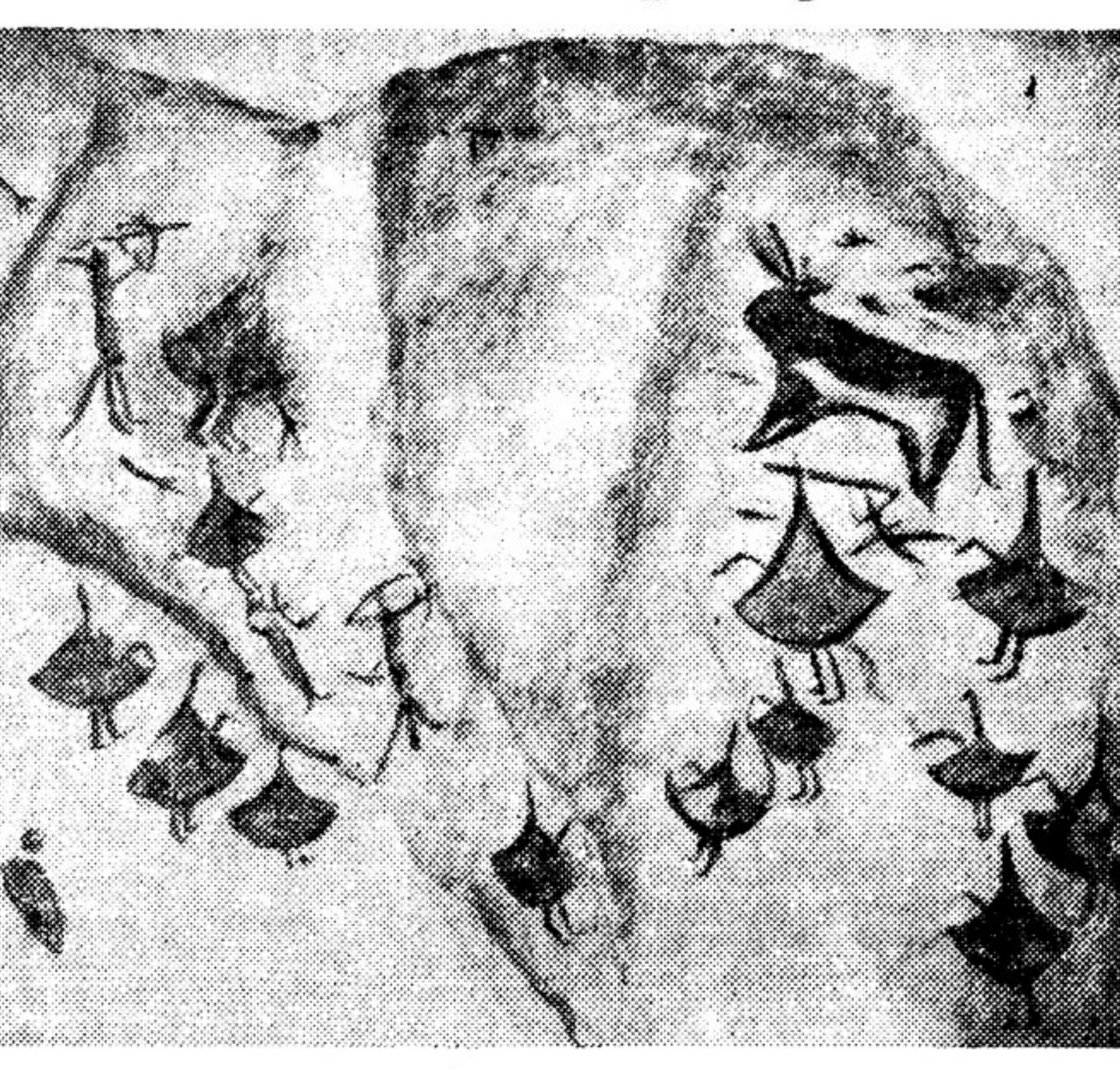
Наскальный рисунок в ущелье Зарзат-Сая.

Быки, изображенные то в «летящем галопе», то упершись в землю; собаки, завернувшие головы назад «за стойку», — все это столь примитивно, но живо, реалистично